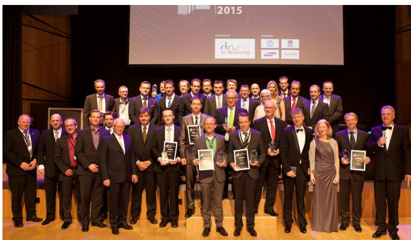
Gewinner des Deutschen Rechenzentrumspreises 2015