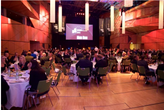
Festliche Gala zur Verleihung des Deutschen Rechenzentrumspreises 2015 im darmstadtium, Darmstadt