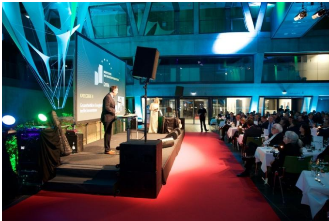
Festliche Gala zur Verleihung des Deutschen Rechenzentrumspreises 2016 im darmstadtium, Darmstadt