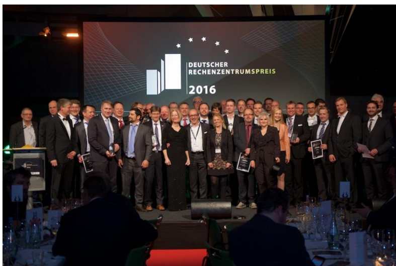
Gewinner des Deutschen Rechenzentrumspreises 2016